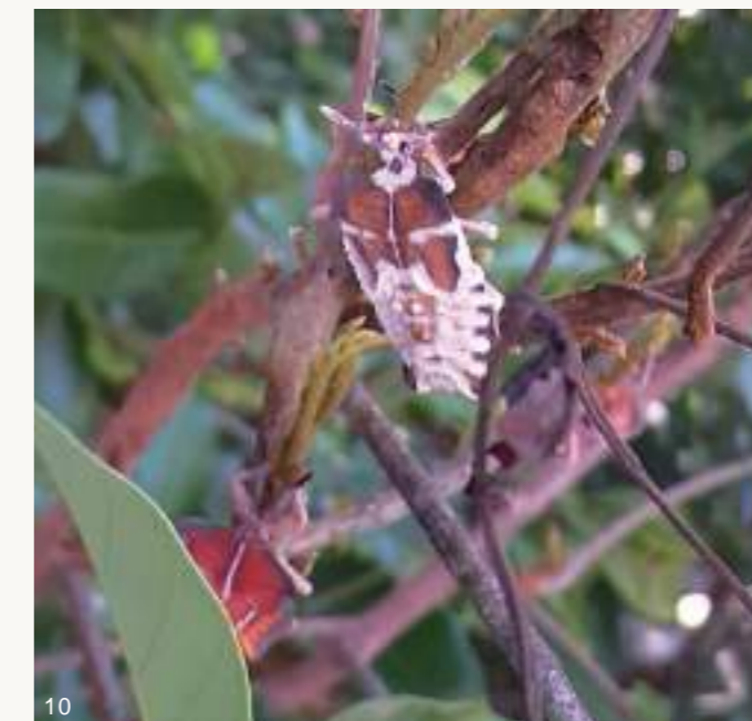
圖10~11. 108年梅雨季前後，大量荔枝椿象若蟲及成蟲感染蟲生真菌而死亡僵直掛在樹上，蟲體內白色黴菌從觸角、足、胸腹部等節間或氣孔、臭腺開孔長出。

寒流，荔枝及龍眼開花量豐，龍眼蜜產量足，但荔枝椿象族群密度也較高。相對的，108年首兩月平均日溫超過16°C為暖冬，無寒流，致使荔枝、龍眼開花結果少而歉收，龍眼蜜也幾乎無收，又加上108年梅雨季前後雨量充沛，若蟲及成蟲個體感染蟲生真菌死亡情形增加，使得該(108)年度荔枝椿象族群數量亦受到衝擊而大幅減少，與107年4~12月同期龍眼樹上荔枝椿象成蟲族群數量具明顯差異。