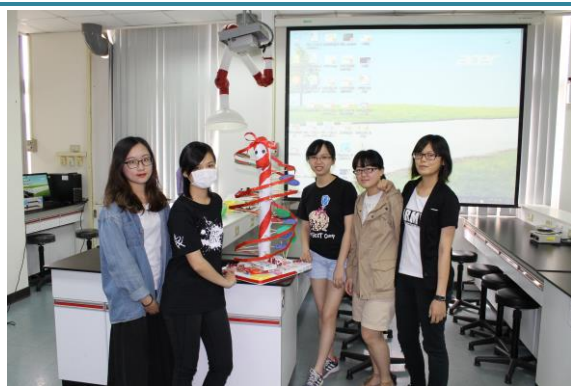
競賽學生與作品合影