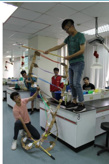
競賽學生作品呈現