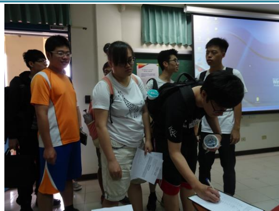
生化系學生排隊簽到