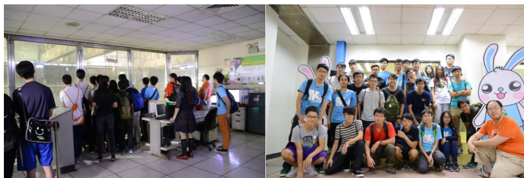
參觀吊車室、控制室、心得分享

作業程序：1. 請於事實後1週內公告。2. 製作完成後請傳系辦。3. 系辦上網公告並列印歸檔。4. 並請登載於個人歷程檔案。