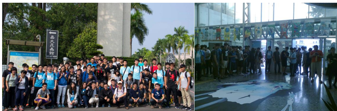
大合照：出發前與大廳