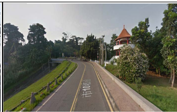
蘭潭校區(清水祖師路及小雅路泛月橋)