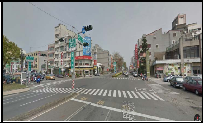
新民校區(新民路側門路口)，同學機車請勿逆向。