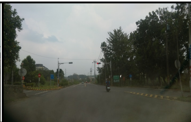
蘭潭校區(彌陀路忠義橋及學府路口)