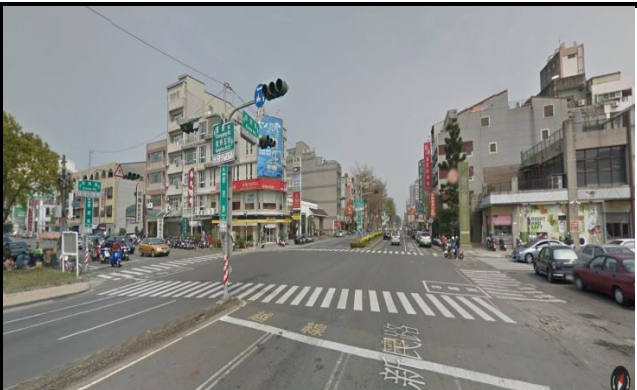
新民校區(新民路側門路口)，同學機車請勿逆向。