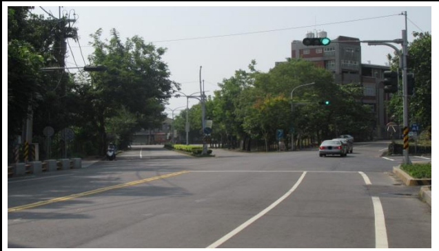
蘭潭校區(彌陀路忠義橋及學府路口)