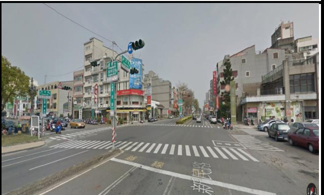
新民校區(新民路側門路口)，同學機車請勿逆向。