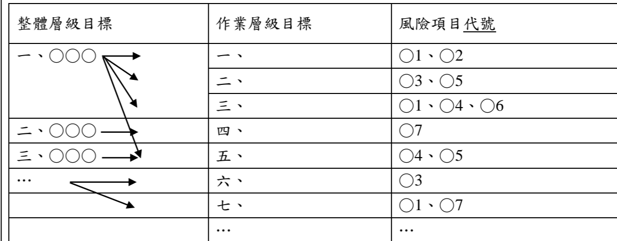
附表一 整體與作業層級目標及風險項目對應表