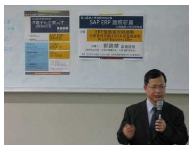
主講人講授主題內容