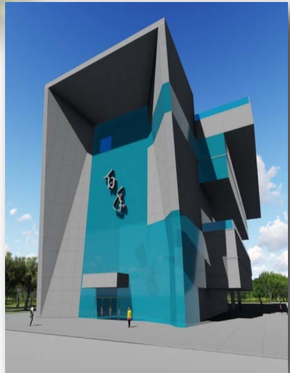
百年館示意圖，1、2樓為校友會及校史室

母校前身「臺灣公立嘉義農林學校」創立於民國8年，「臺灣省立嘉義師範學校」創立於民國46年，兩校於民國89年整併成立「國立嘉義大學」，今（108）年適逢創校一百週年，雖景物變遷，人事更迭，但學生時期的年少時光總是美好且令人懷念，誠摯地邀請您回校參加校慶，看看母校的進步與發展。為了迎接嘉大創校一百週年，我們成立了創校一百週年紀念慶祝活動籌備會，積極準備一百週年紀念慶祝相關活動，謹先簡單介紹，與您分享：