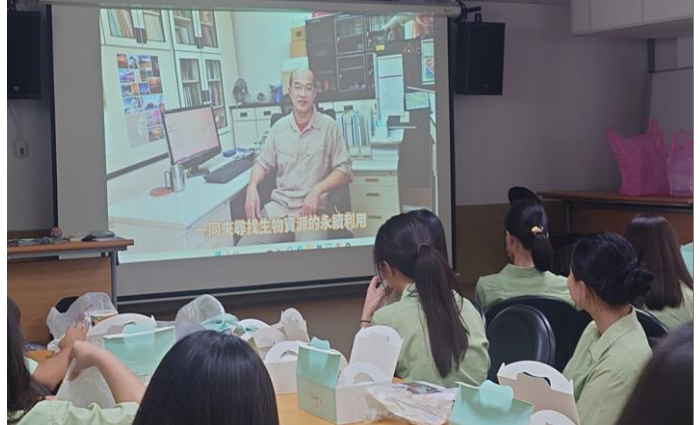
說明：播放影片介紹系所特色