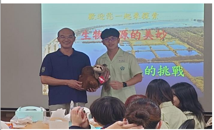
說明 學生代表致贈紀念品