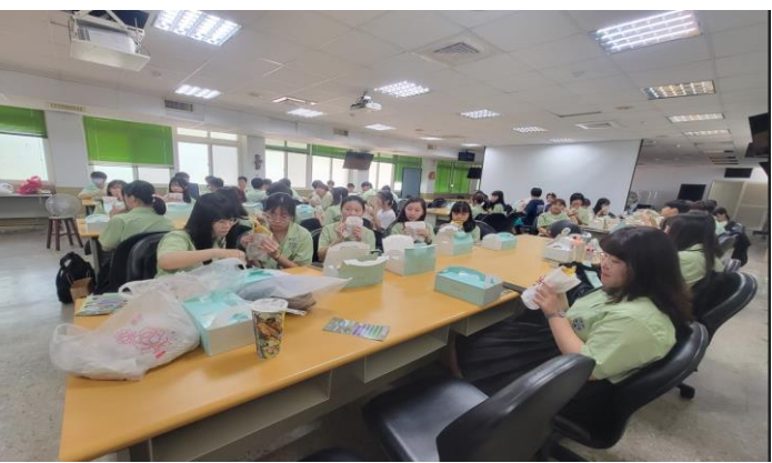
說明：會後餐點及學生交流