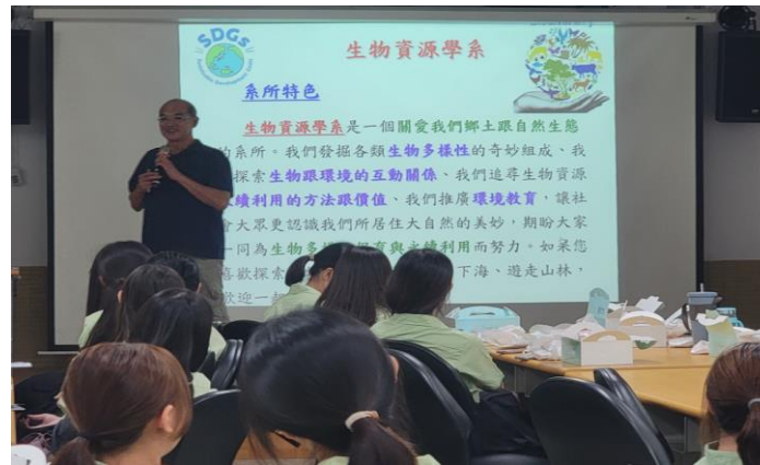
說明：會後學生詢問相關問題