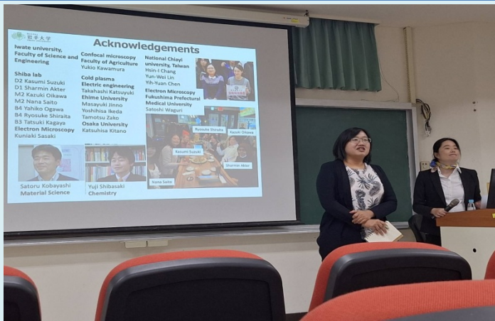
張心怡教授介紹演講者