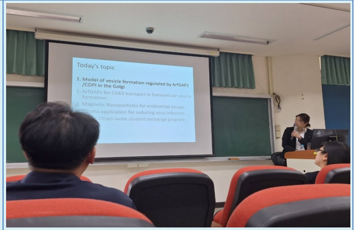
演講者解說演講的主題與內容