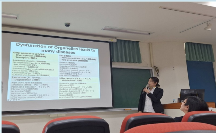
演講者介紹細胞功能障礙導致的疾病