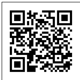
一般報名 QR code

https://forms.gle/KTgXh7vhninYcj39 )，即日起至 4 月 30 日下午五點以前完成報名（現場報名人數上限預定為 250 人）。