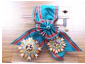
一等卿雲證書及勳章

◆藝品暨數位資源展示室： 以日晷、嘉義市空照圖及嘉義市花設計展間地板，且多元地呈現蕭前副總統一生的行政事蹟；地上之立體圓弧展示分為四區：以出生嘉義、擔任財經重要官職、出任行政院長及當選第十二任副總統等四階段來呈現。此展間亦有大型觸控電腦及多媒體播映室，互動化設計展示數位化文物館的資料並可播映蕭先生生平的影音資料。