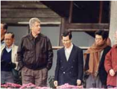
1993 年出席西雅圖 APEC 會議

泰國蘭實大學頒授榮譽哲學、政治學及經濟學博士學位，90 年創立財團法人兩岸共同市場基金會並擔任董事長，同年並率團首次訪問中國大陸。97 年與馬英九總統搭檔，當選第十二任副總統，同年參加博鰲論壇，與中共國家主席胡錦濤會面，提出「正視現實、開創未來、擱置爭議、追求雙贏」十六字箴言，打破八年來冰封的兩岸關係，被稱為「兩岸融冰之旅」。99 年獲巴拿馬共和國副總統兼外交部長瓦雷拉（Juan Carlos Varela）頒贈該國最崇高榮譽等級的「巴爾波大十字勳章」，以感謝蕭副總統對促進兩國邦誼的貢獻。101 年因健康狀況卸任副總統職位。