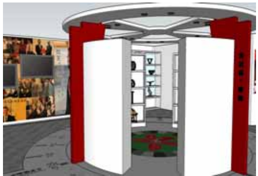
藝品暨數位資源展示室

◆藝品暨數位資源展示室： 以日晷、嘉義市空照圖及嘉義市花設計展間地板，且多元地呈現蕭前副總統一生的行政事蹟；地上之立體圓弧展示分為四區：以出生嘉義、擔任財經重要官職、出任行政院長及當選第十二任副總統等四階段來呈現。此展間亦有大型觸控電腦及多媒體播映室，互動化設計展示數位化文物館的資料並可播映蕭先生生平的影音資料。