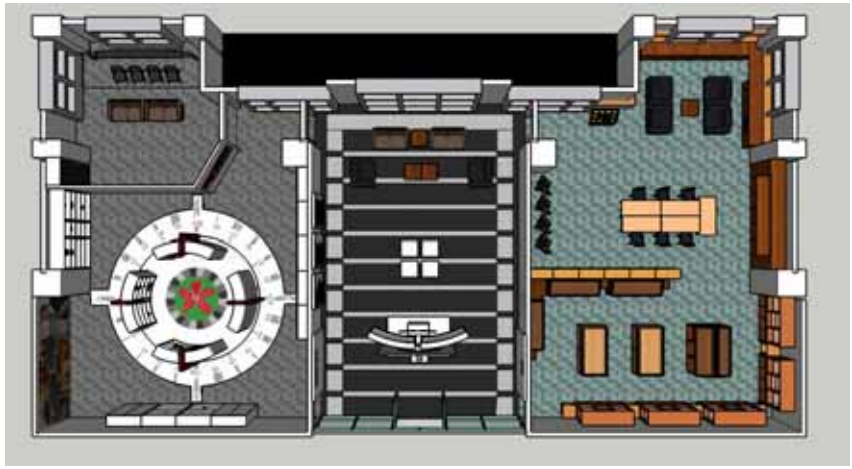
文物館平面配置圖