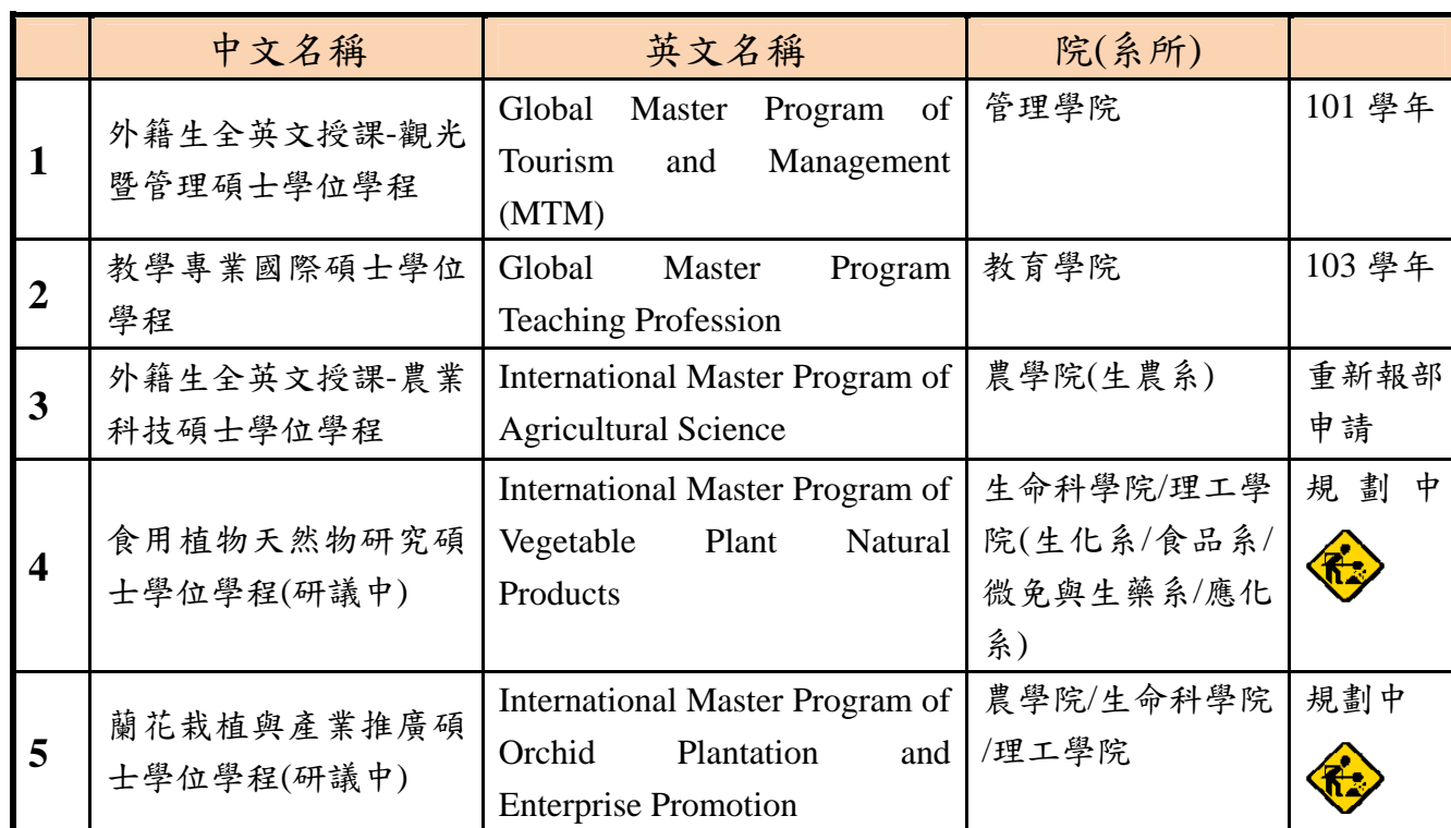
表 1、本校全英文授課學位學程及籌設中學位學程