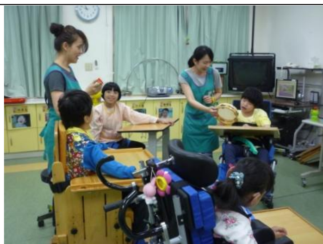
請學生拍鈴鼓開始進入上課的情緒