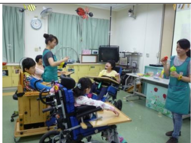
享受下課前的歡樂時光