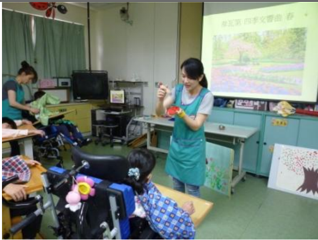
老師示範在瓢蟲上蓋章的動作