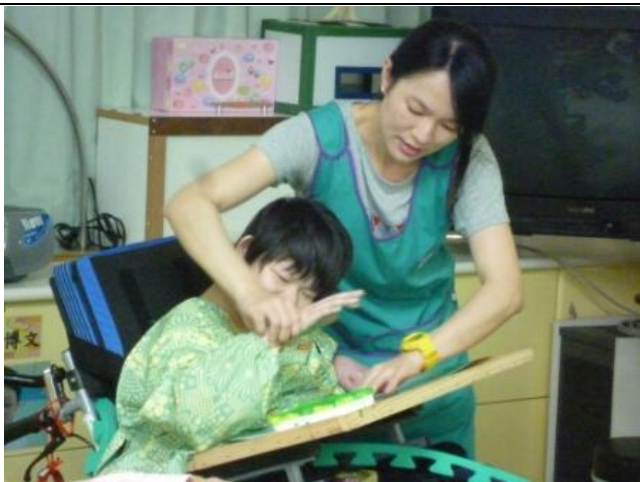
根據學生能力設計手印畫