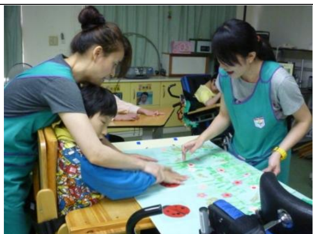
將每位同學做的部件組合貼上