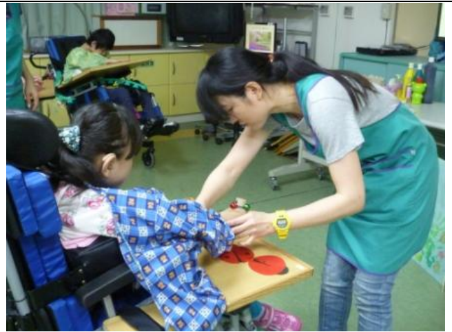
協助學生操作，手部輔以T字帶輔具