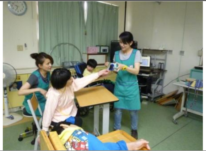
撕下圖卡替代按壓溝通輔具