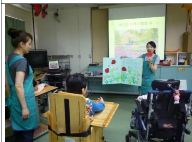
共同欣賞最後的成果