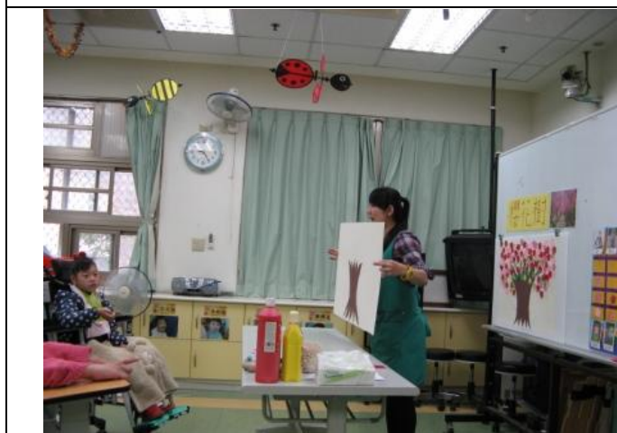
老師說明製作櫻花樹流程