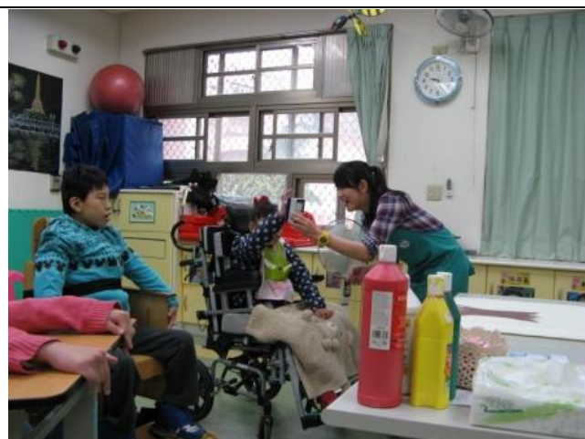
學生用溝通輔具回答