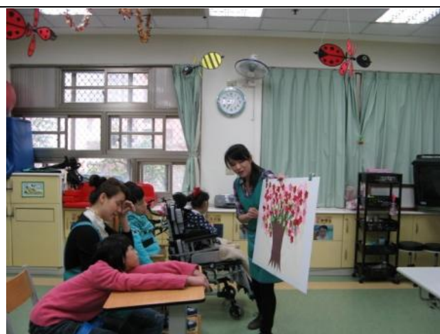
請學生觀察櫻花的顏色