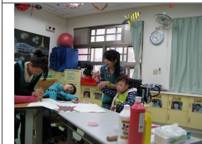
印章上有鈴鐺輔以聽覺提示