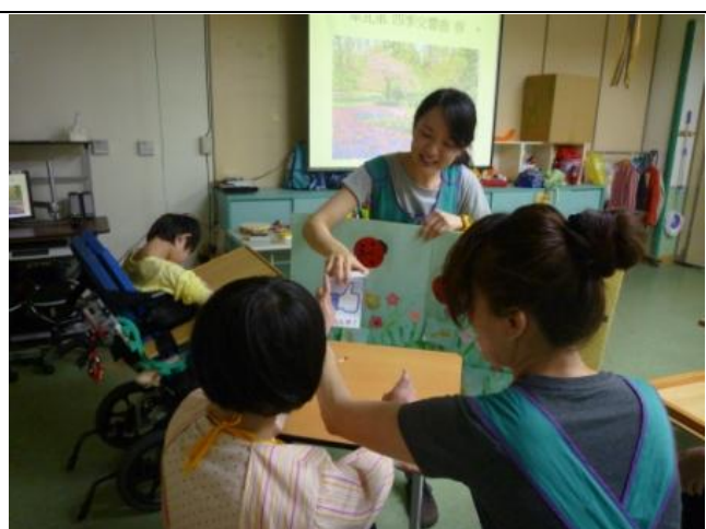
給自己及同學按個讚吧！