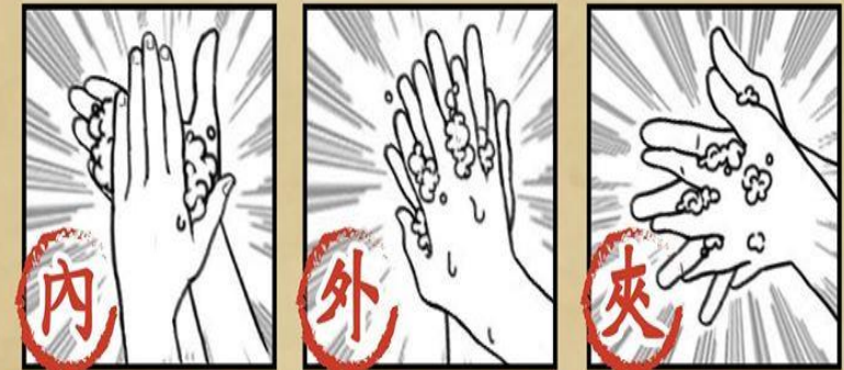
搓揉手掌 搓揉手背 搓揉指縫